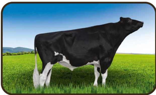
PAI REGANCREST-GV S BRADNICK-ET