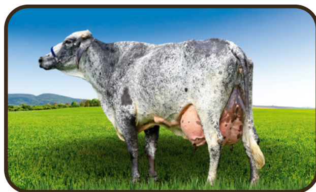
MÃE BELGA FIV RAÍZES FUNDÃO