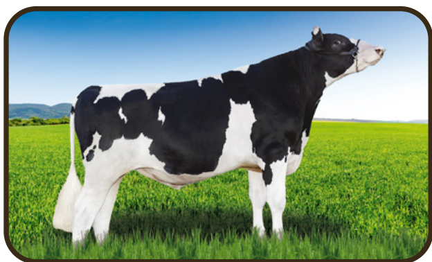
PAI - BLUMENFELD FRAZLD BRASS-ET