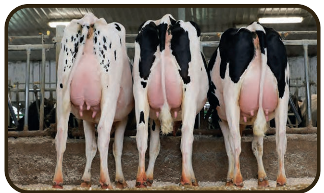
IRMÃ: ALPHABET DAUGHTER GROUP AT ROCHELAU